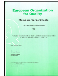
Сертификат Европейской Организации по Качеству («EOQ»)