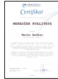
Сертификат «Oskar Edukos»