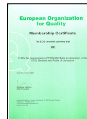
Certifikat Europske Organizacije za Kvalitetu